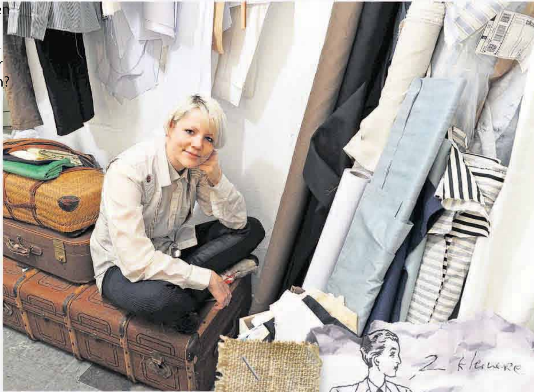
„Mein Heimatgefühl ist sehr groß. Ich komme vom bayerischen Land und fahre gern dahin zurück. Die Landschaft inspiriert mich und ich denke, dass die Sehnsucht nach den Bergen auch aus meiner Kollektion spricht. Deswegen ist sie jedenfalls so ein bisschen im Fröhen zu. Berge mächtig angehaucht, rustikal, mit alten Holzskripten. Neon und Plastik wird es bei mir nicht geben.“

Oberflächlich gesehen belegen diese Zahlen, dass Klaus Wowerits Rechnung aufgeht: Tatsächlich schafft Kreativität in der Stadt Infrastruktur, die wiederum schafft Arbeitsplätze. Aber dort, wo viele gewinnen, gibt es immer auch viele, die verlieren. Zum Beispiel die Armada jener Kreativarbeiter, die von der Hand in den Mund lebt. Ein Wirtschaftsanwalt schätzt man, dass auf jeden sozialversicherungsrechtlichen Arbeitnehmer in der Branche mindestens ein Freelancer kommt, der weniger als 17 500 Euro pro Jahr verdient. Das ist jene Klientel, die hier mal ein „Projekt“ macht und dort mal eins, und immer gerade genug Geld verdient, um sich noch einen Latte Macchiato im „St. Oberholz“ leisten zu können. Das Café in Mitte gilt seit Jahren als Heimatthron der digitalen Bohème. Wie Nachwuchs-Models sitzen sie da, blicken über die Bildschirme ihrer Macbooks hinweg, immer in der Hoffnung, entdeckt zu werden. Es wirkt wie ein Casting, Germany's next Topkreativ-