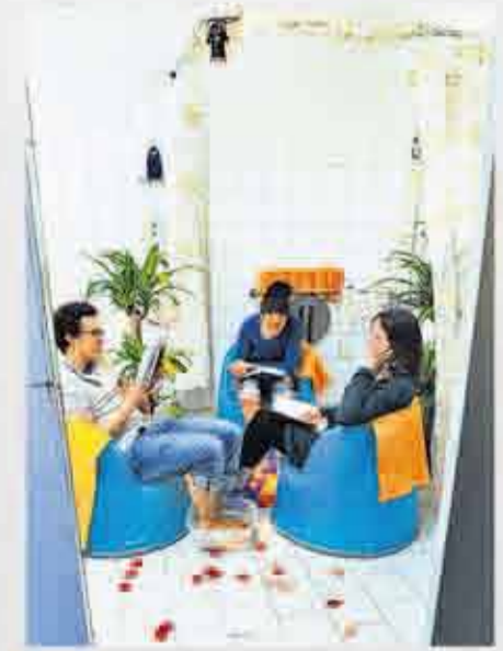
Entspannt denken, Ideen weiterentwickeln: Teilnehmer des EU-Workshops

Die Idee In der Akademie für Visionautik soll es vor allem um eines gehen: Ideen weiterentwickeln, Visionen von einer besseren Welt schaffen und sie umsetzbar machen. Die Visionauten wollen gesellschaftlichen Missständen kreativ begegnen. In Workshops mit Organisationscoaches, Psychologen, Unternehmensberatern und anderen sollen die Teilnehmer auf den richtigen Pfad geführt werden. Die Vision „Wir finden, dass jeder Mensch das Recht hat, mit Schwung und Lebensfreude die Welt mitzugestalten.“ So steht es im Vorwort zur diesjährigen Winterwerkstatt der Visionauten. Und dort steht auch, dass es davon träumen, dass jeder Mensch auf der Welt von seinem Recht, mitzugestalten, Gebrauch macht.