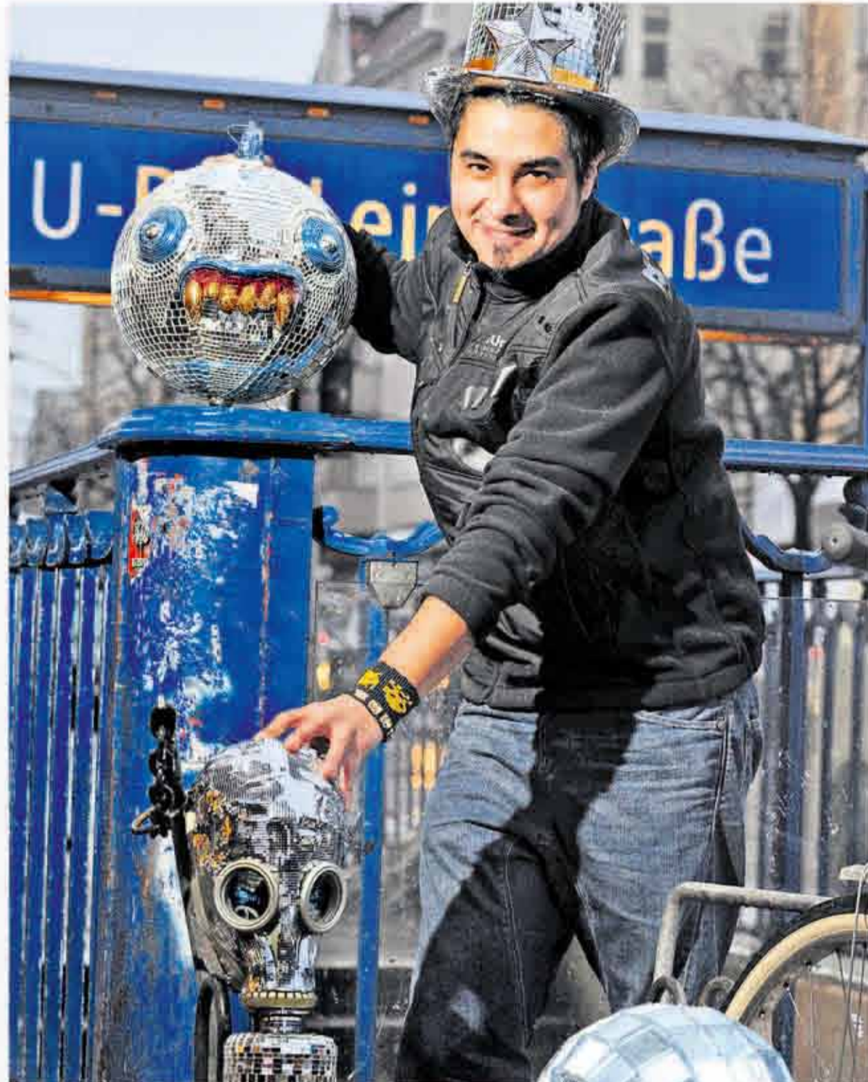
„Kunst und Berlin“ das sind zwei Begriffe der Freiheit, zwei Dinge, die perfekt zusammenpassen. Ich bin kein reicher Mann und habe keinen großen Namen als Künstler. Für mich ist nur wichtig, dass ich arbeiten kann. Der Prozess der Herstellung macht mich glücklich.“

Ab Mittwoch stellt Porsche ihre erste komplette Herren- und Damen-Kollektion auf der Fashion Week vor. Vier Tage lang kann man ihre Mode bei der Projektgalerie im HBC in Mitte sehen, es ist der erste kleine große Erfolg. 2011 soll ihr Jahr werden. Berlin hängt New York ab Von Erfolg durch Kreativität träumen viele. Das Berlin dafür eine gute Anlaufstelle ist, hat sich herumgesprochen. In Umfragen unter einflussreichen Kreativschaffenden, die das Internetportal Hubculture regelmäßig durchführt, findet sich Berlin auf der Rangliste der „Zeitgeist-Metropolen“ auf den vorderen Plätzen wieder. Das Zeitgeist-Ranking misst anhand verschiedener Faktoren Dinge wie Innovation, Wandel und Anziehungskraft einer Stadt. Berlin gilt als „Anführer des Untergrunds“. Der vergangenen Jahre landete Berlin auf Rang zwei, hinter Sao Paulo, New York und London, einstige Sehnsuchtsorte der Kreativen, stehen abgeschlagen auf den Plätzen acht und neun. Der Ruf Berlins als Künstlermetropole verselbstständigte sich in der letzten Dekade. Auch weil neben der Armee der Namenlosen viele Prominente kamen,